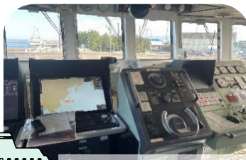
鳥取県境港総合技術高等学校実習船 若鳥丸