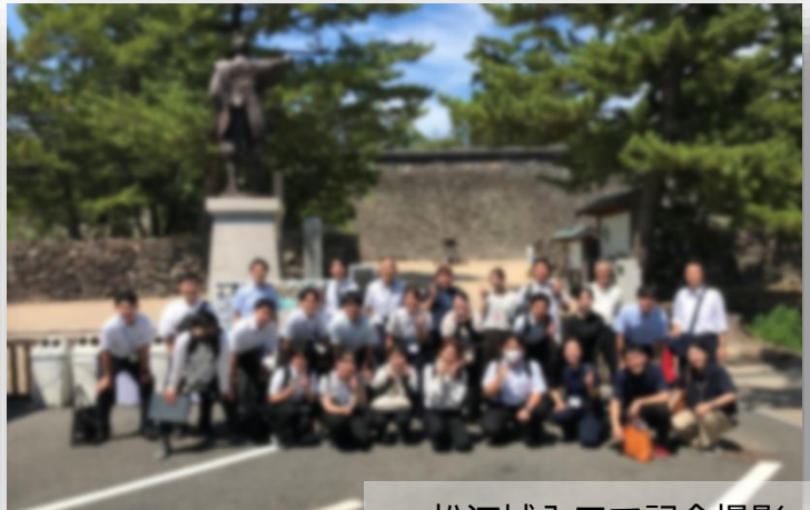
松江城入口で記念撮影