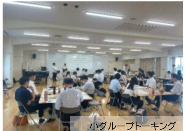
小グループトーク