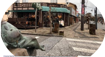
水木しげるロード

本セミナーは、山陰両県が抱える課題の解決と学び続けていく教師の育成を志し、若手教員の指導力向上及び、教員相互のネットワークの構築を目指すことが目的です。教員仲間との議論を通して人とつながり、明日の子どもたちにどのように関わるかを考えていきます。山陰の子どもたちの未来のために語り合いませんか？