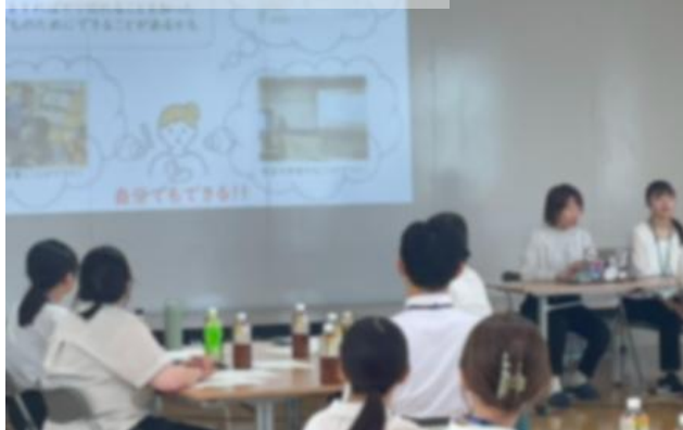
参加者による実践の発表