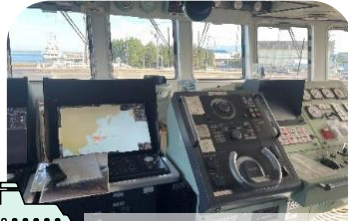
鳥取県境港総合技術高等学校実習船 若鳥丸