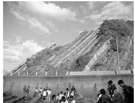
図1 島根半島小伊津海岸の砂泥互層

ここでは砂泥互層を観察する事で、その地域がどのようにして形成されたかを理解するとともに、砂岩や泥岩そのものの質感や粒の大きさなどの岩相の違いについて観察・実感することができる。