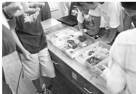
図3 F小学校での授業の様子