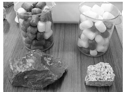
図6 岩石の見え方のモデル