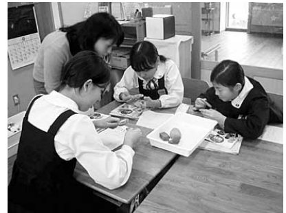
図5 岩石教材の観察の様子

図6は鉱物の組み合わせやその量比により岩石の見え方が異なることを示したモデルである。白色スポンジを無色鉱物、黒色スポンジを有色鉱物とし、白色スポンジ