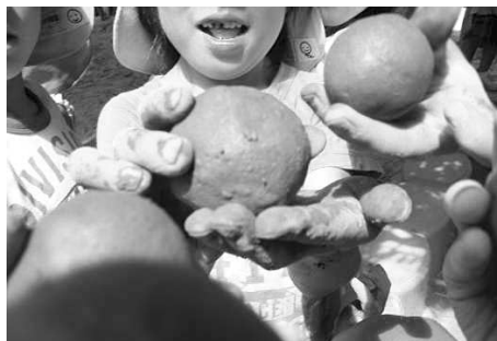
図2 A保育園での泥団子づくりの様子