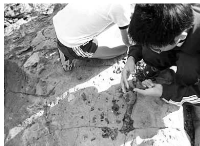
図4 化石採取の様子

ねらい：松江市加賀の須々海海岸で見られる砂泥互層にて野外実習を行い、地層の大きさや感触を体験することにより、砂岩と泥岩の違いや地層ができるまでの年代などの自然の時間的・空間的スケールなどを感じる。