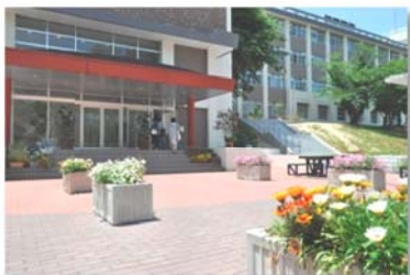
正面入口前広場の花や観葉樹