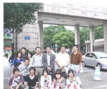
中国 浙江大学訪問