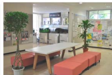
1階ホール 憩いのスペース