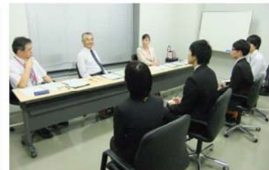
採用試験等の面接指導