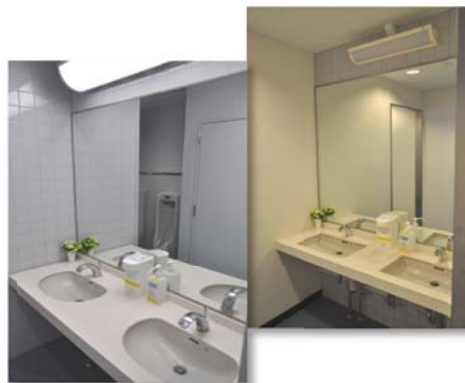
清潔感あふれるトイレ