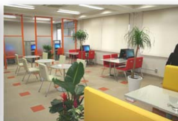
明るくて快適な ICTルーム 金魚鉢