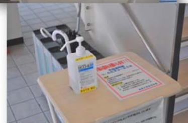
各所に配置された消毒液